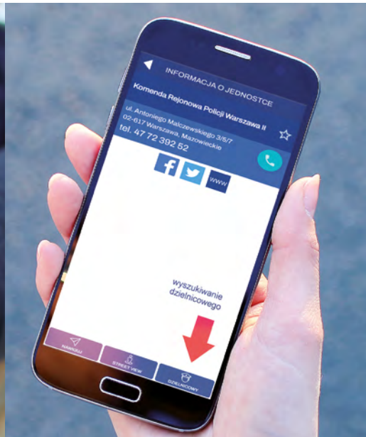
Wyszukiwanie dzielnicowego w określonej jednostce Policji.