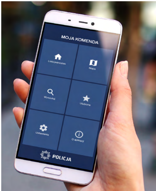
Nawigacja w aplikacji.