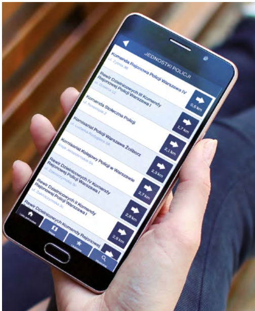
Dane jednostek Policji.